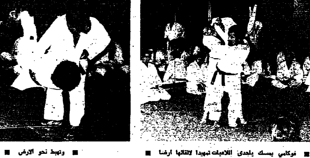
نوكامي يسك يلجدي الالعبات تهيدا لهما ارضا